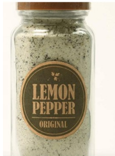
(直径 = 6cm)