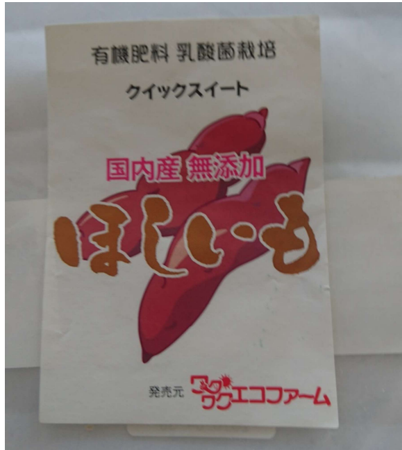
(≒ 10cm × 7cm)